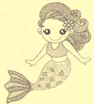
大網白里市のキャラクター マリン