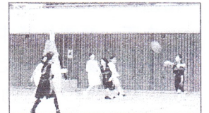
バスケットボール部の試合