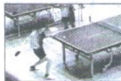
卓球シングルスの様子