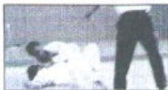
柔道団体戦の様子