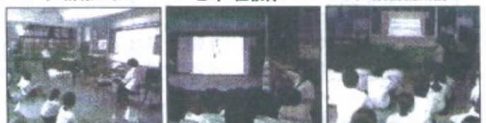
各学年の講話の様子