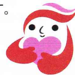
犯罪被害者等支援シンボルマーク 「ギョuttoちゃん」